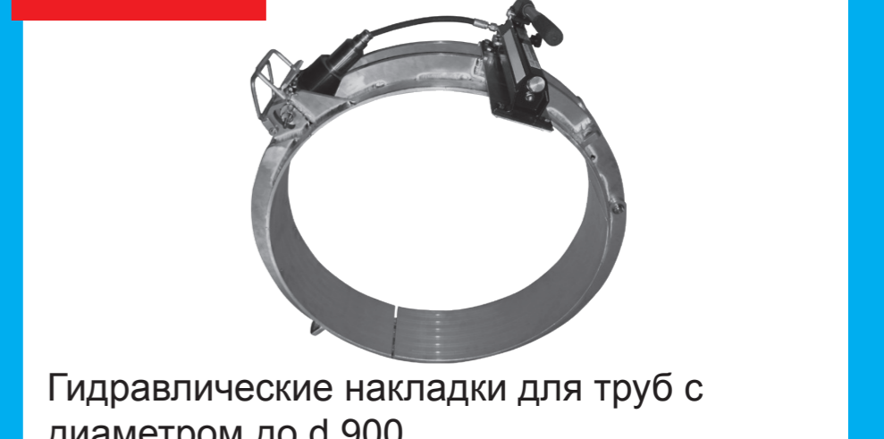
Гидравлические накладки для труб с диаметром до d 900

Более подробную информацию относительно продукции FRIALEN® XL вы можете найти в наших брошюрах, технических паспортах изделий, руководствах по монтажу и учебных фильмах, которые Вы можете загрузить на сайте www.frialen-xl.de .