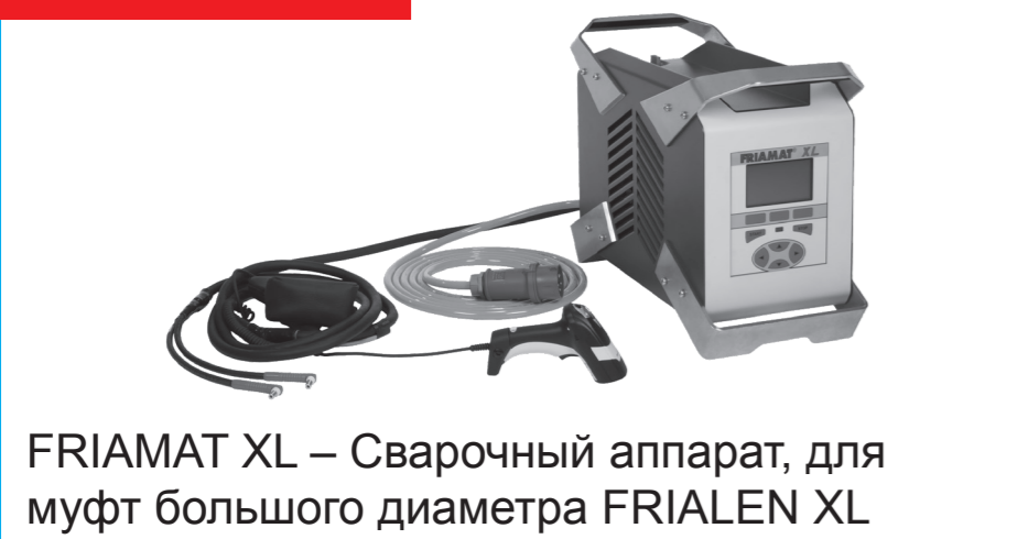
FRIAMAT XL – Сварочный аппарат, для муфт большого диаметра FRIALEN XL