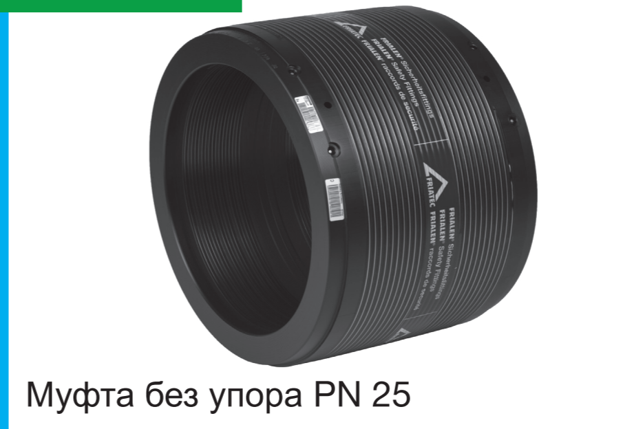
Муфта без упора PN 25