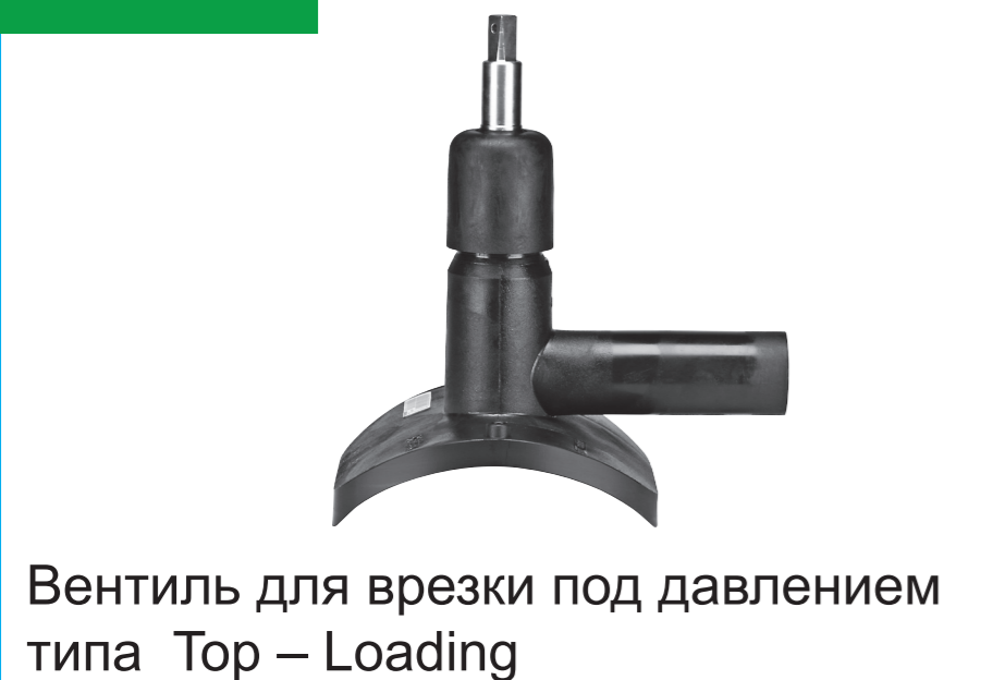
Вентиль для врезки под давлением типа Top – Loading