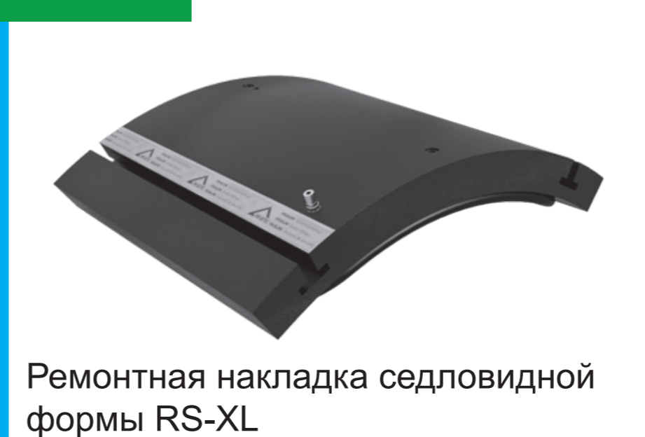
Ремонтная накладка седловидной формы RS-XL