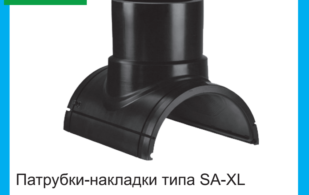
Патрубки-накладки типа SA-XL