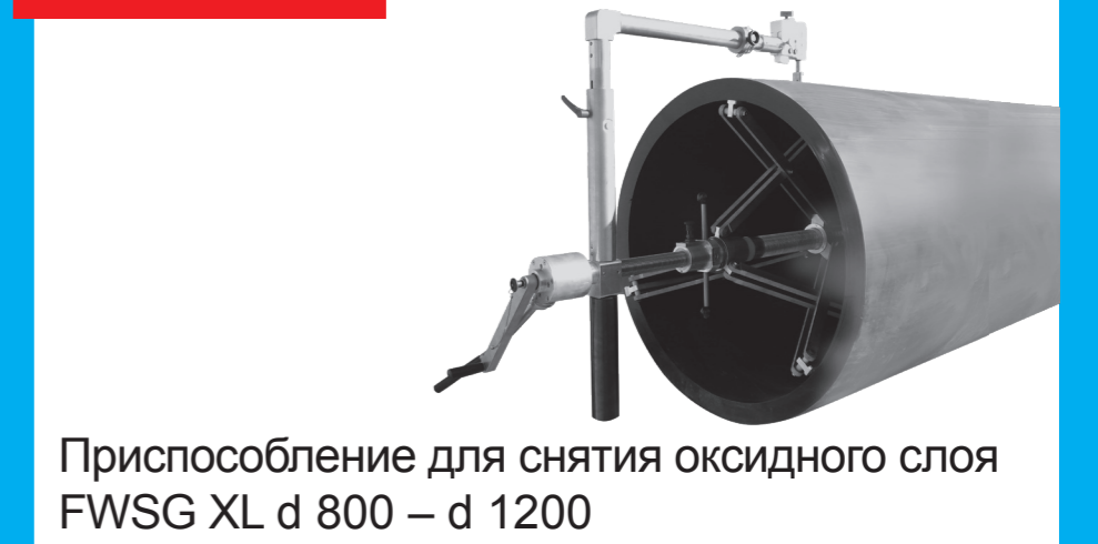
Приспособление для снятия оксидного слоя FWSG XL d 800 – d 1200