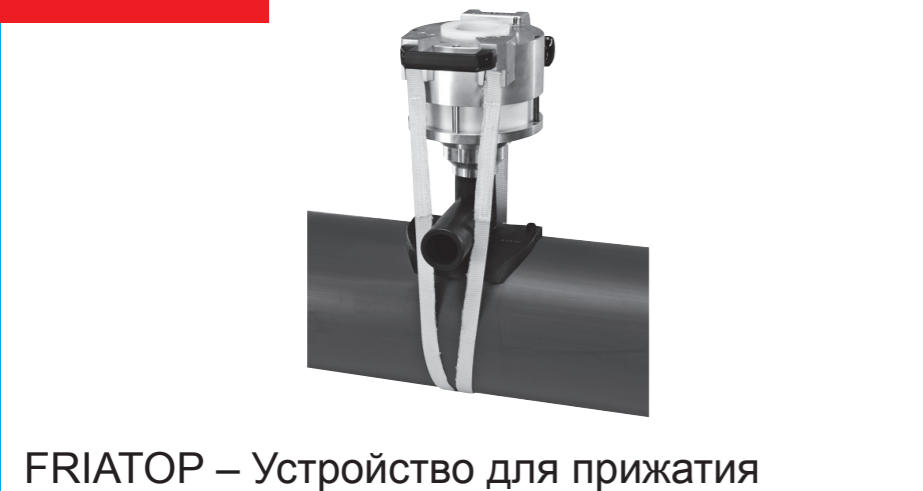
FRIATOP – Устройство для прижатия