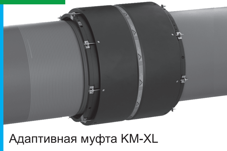
Адаптивная муфта KM-XL