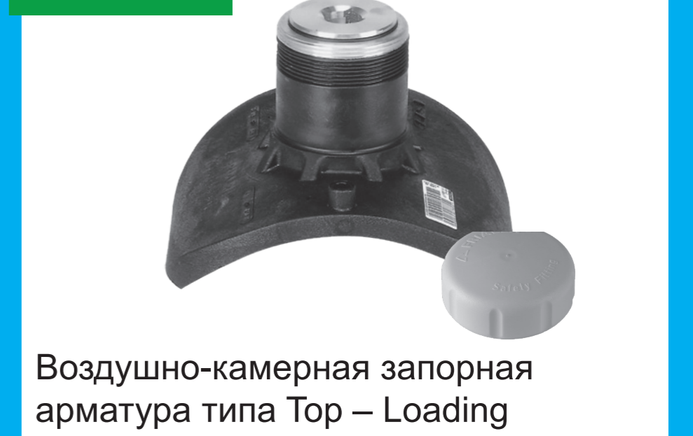
Воздушно-камерная запорная арматура типа Top – Loading