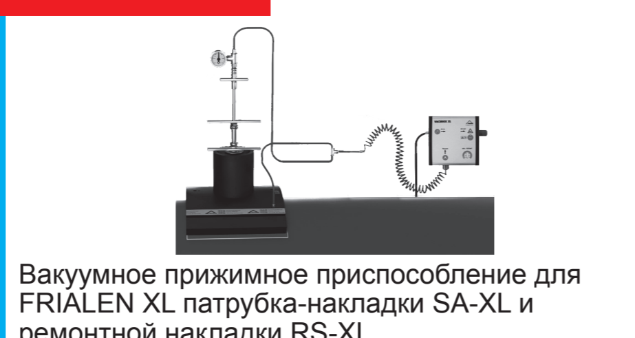
Вакуумное прижимное приспособление для FRIALEN XL патрубка-накладки SA-XL и ремонтной накладки RS-XL