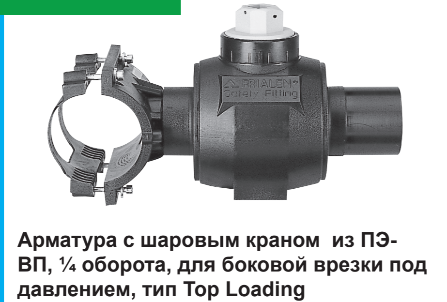
Арматура с шаровым краном из ПЭ-ВП, ¼ оборота, для боковой врезки под давлением, тип Top Loading