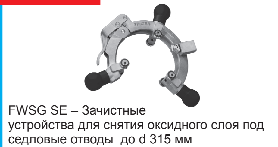
FWSG SE – Зачистные устройства для снятия оксидного слоя под седловые отводы до d 315 мм