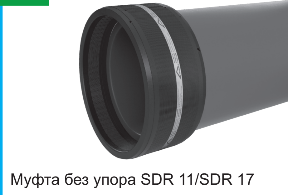
Муфта без упора SDR 11/SDR 17