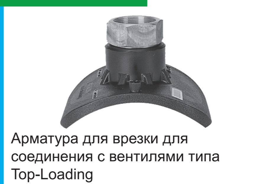
Арматура для врезки для соединения с вентилями типа Top-Loading