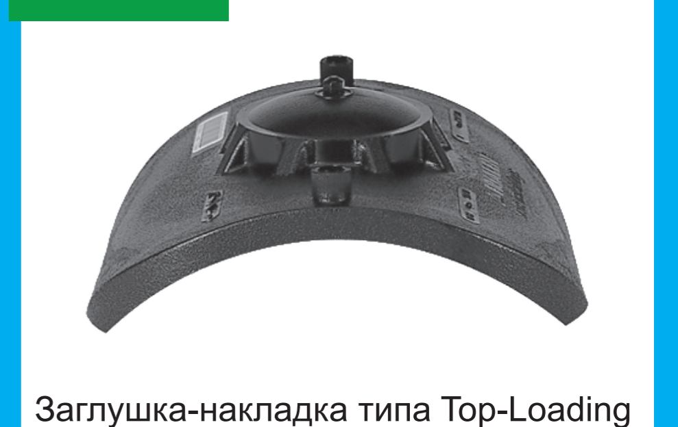
Заглушка-накладка типа Top-Loading