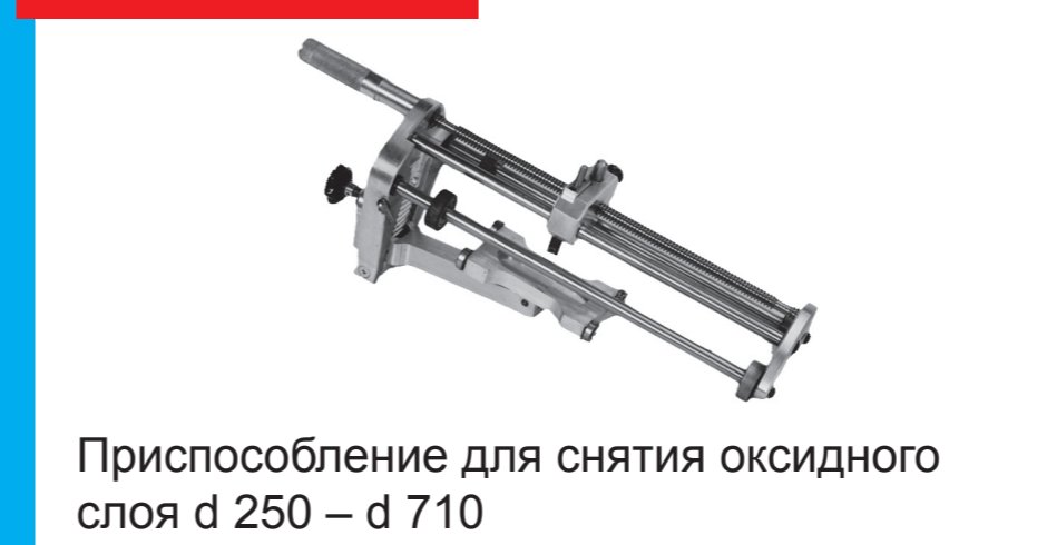
Приспособление для снятия оксидного слоя d 250 – d 710