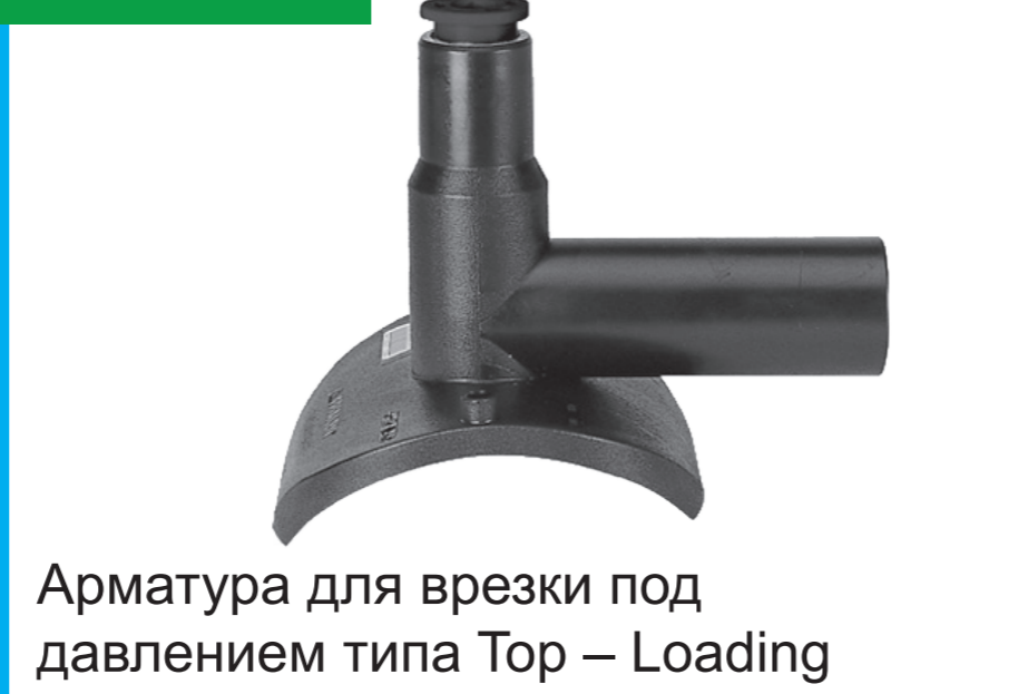
Арматура для врезки под давлением типа Top – Loading