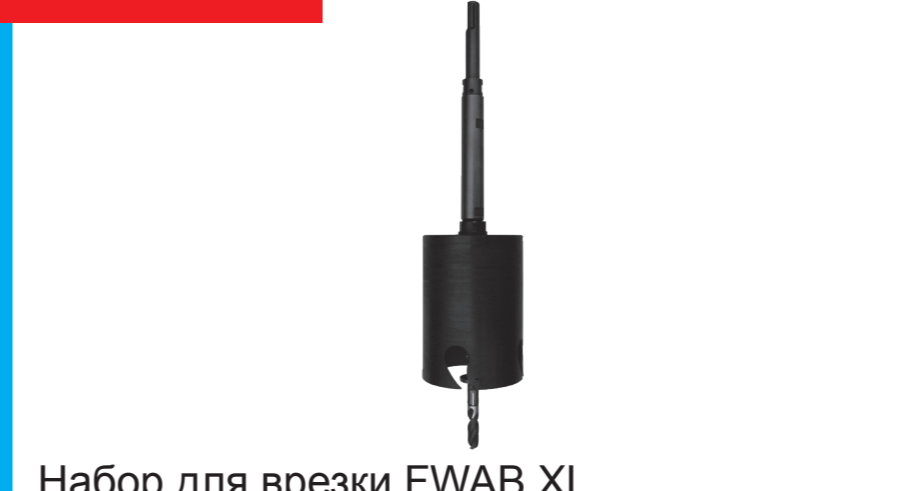
Набор для врезки FWAB XL